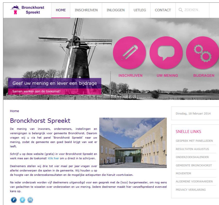
Figuur 1 Screenshot portal online panel Bronckhorst Spreekt

De volgende afbeelding toont een screenshot van de homepage van het Bronckhorst Spreekt portal (www.bronckhorstspreekt.nl van dinsdag 18 februari 2014).